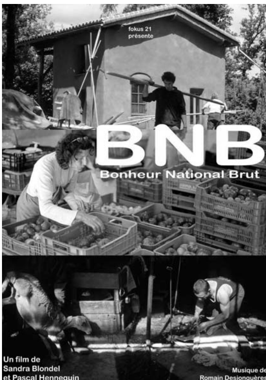
Un film de Sandra Blondel et Pascal Hennequin